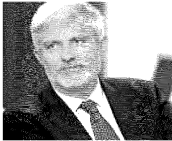
Giorgio Palmucci, presidente Enit

I visitatori, per evitare di fare la fila all'ingresso, possono registrarsi prima, gratuitamente, direttamente dal sito web attraverso la piattaforma eventbrite https://hospitality-sud2020.eventbrite.it